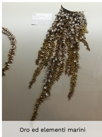
Oro ed elementi marini