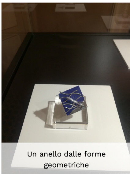
Un anello dalle forme geometriche

L'obiettivo è proprio quello di avvicinare non solo gli appassionati del gioiello, gli intenditori e gli addetti del settore, anzi. E' un invito alla città ad immergersi in un mondo fatto di metalli e pietre preziose , di forme sinuose e spigolose, fiori, foglie e farfalle, ma anche insetti, conchiglie e maschere tribali tutte rigorosamente preziose.