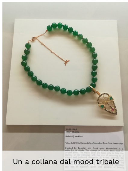
Un a collana dal mood tribale