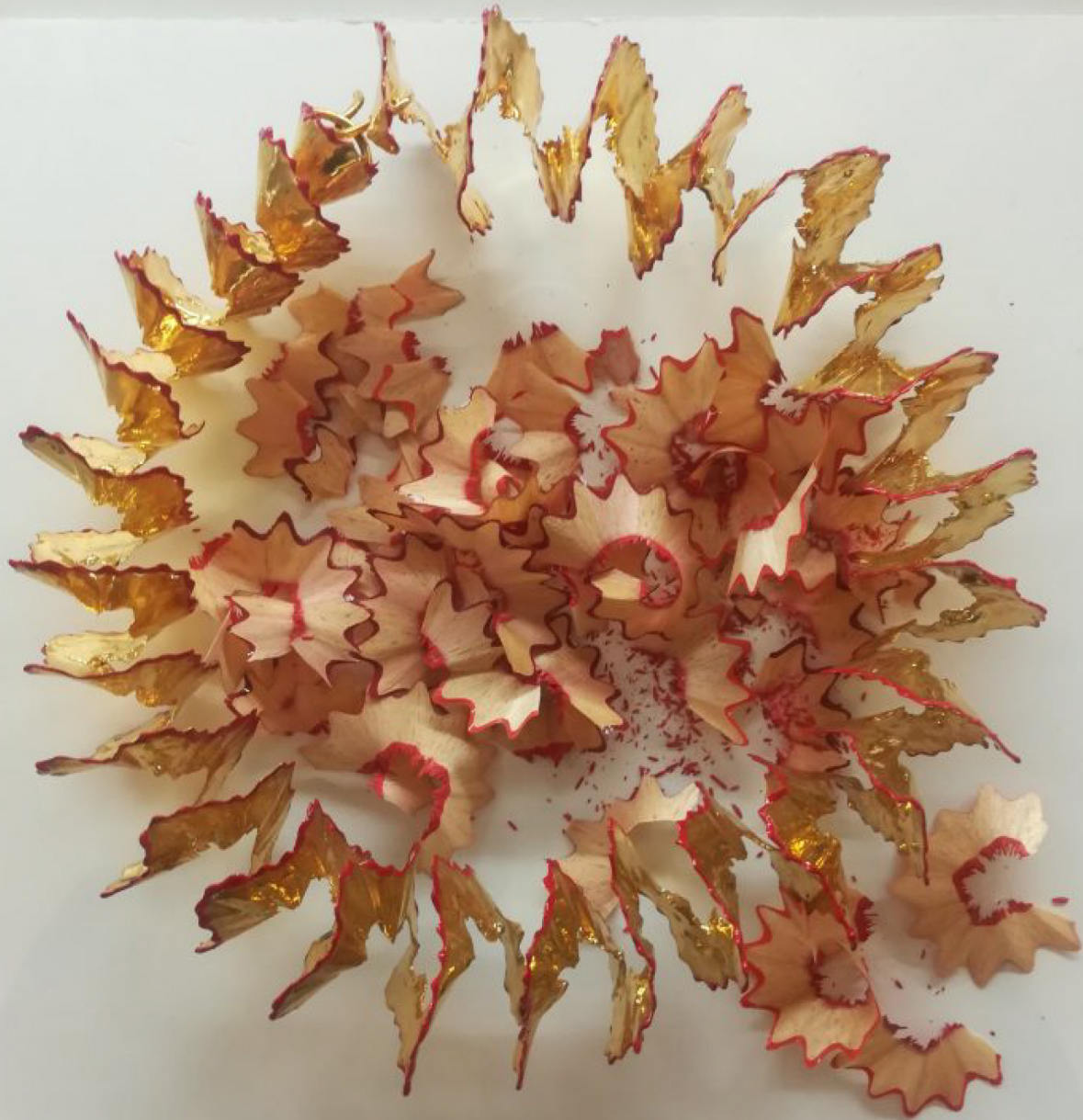
Un bracciale "alla schiava"