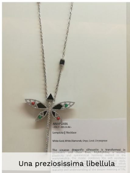
Una preziosissima libellula