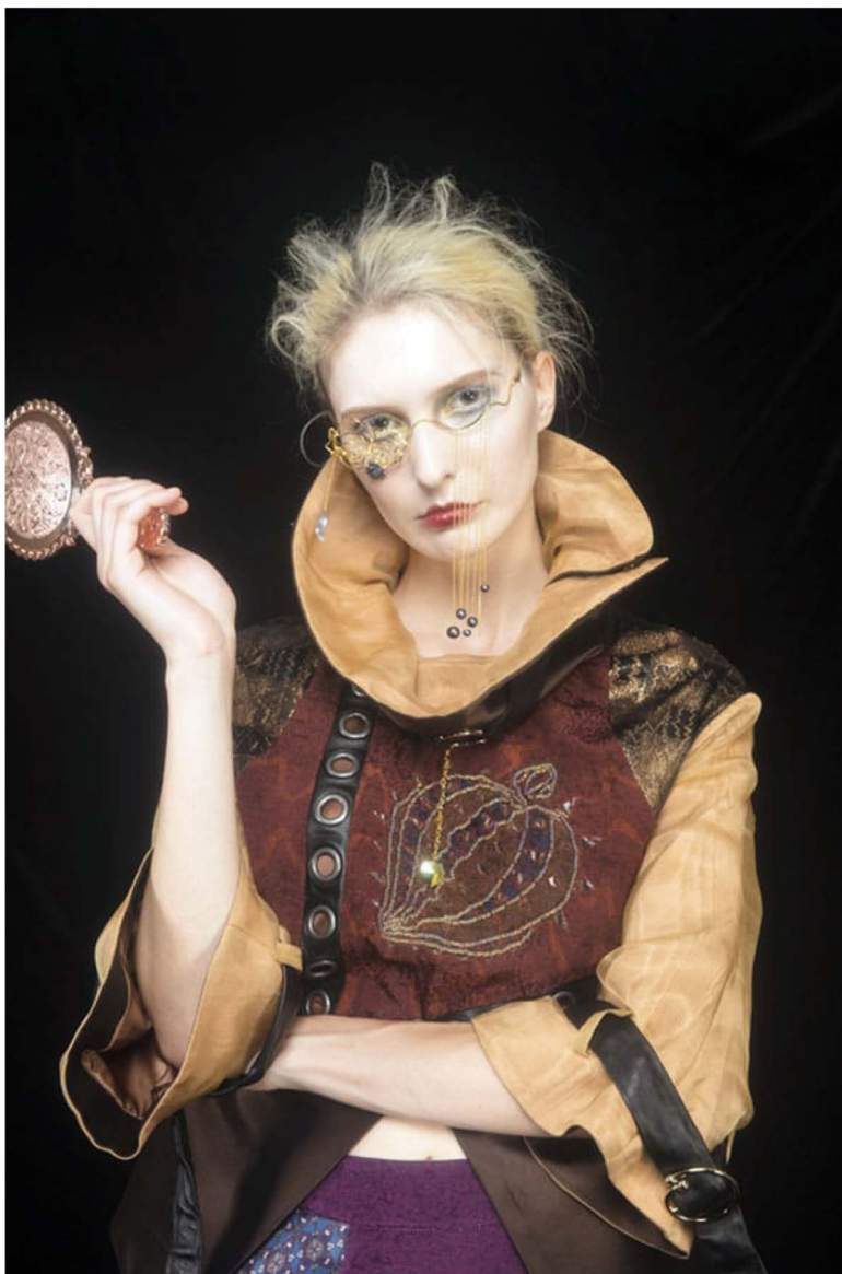
Yusva Jewelry, Silverlight Rosé Sight Eyewear

Tra le oltre 500 candidature ricevute da tutto il mondo, i curatori di Artistar Jewels hanno selezionato 150 artisti provenienti da 40 Paesi diversi, tra i quali Taiwan, Thailandia, Libano, Armenia, Israele e Kuwait e una forte presenza Nordamericana. In particolare, lo U.S. Export Assistance Center di New York ha contattato il Diamond District Partnership, che ha organizzato un contest per dare la possibilità ad un artista newyorchese di partecipare all'evento con il supporto di questo ente di New York. La guerra dei dazi, insomma, non ha ancora fatto danni in questo settore.