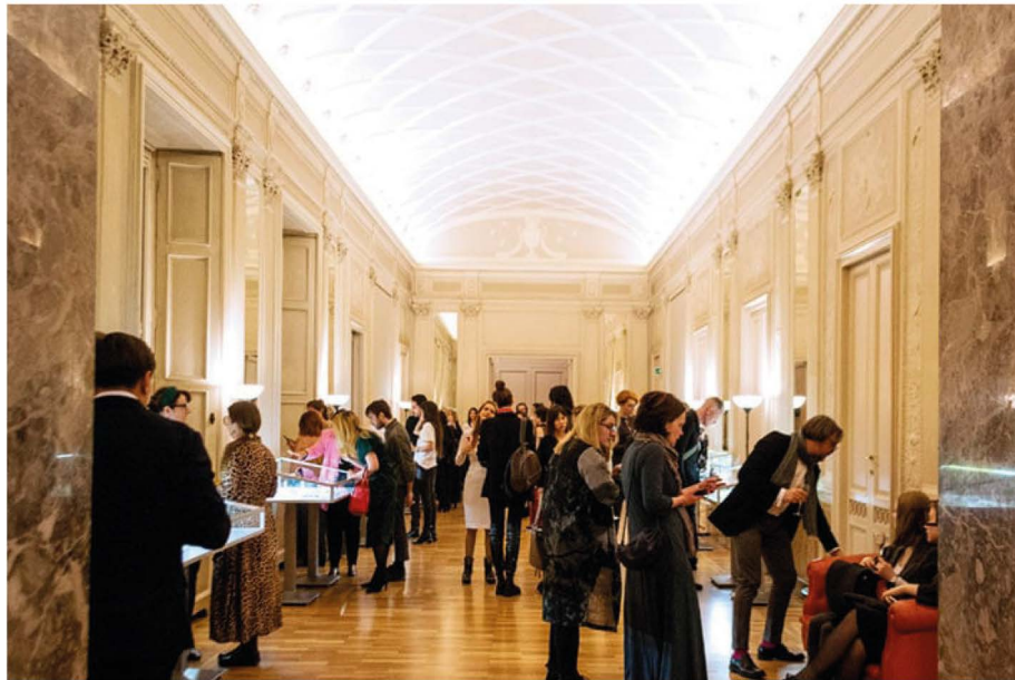
L'edizione primaverile di Artistar Jewels a Palazzo Bovara